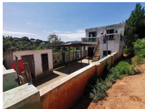
Soa school (l'école du savoir pour tous)