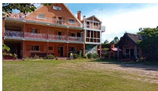
Le Relais du Rova

Changement de cap pour la seconde partie du séjour. Direction Andasibe , le village se situe en pleine forêt primaire au milieu de la verdure et d'une végétation tropicale. On y parvient par la RN2 dont l'état lamentable, les virages et les reliefs donnent le temps d'admirer le paysage montagneux.