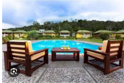
Hôtel Lémurs Lodge