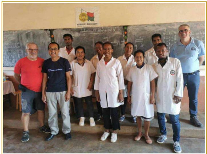
Une partie de l'équipe pédagogique pendant la SoliRando